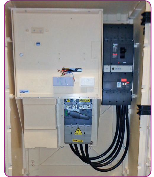
Exemple d'équipement intérieur : coffret BPS 400A avec sectionneur + disjoncteur (AGCP)