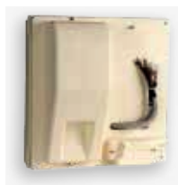
Tableau de comptage variante 2 ivoire

Usage intérieur, panneau de contrôle équipé de boîtes d'essai, de faisceaux de câble et d'un bornier client.